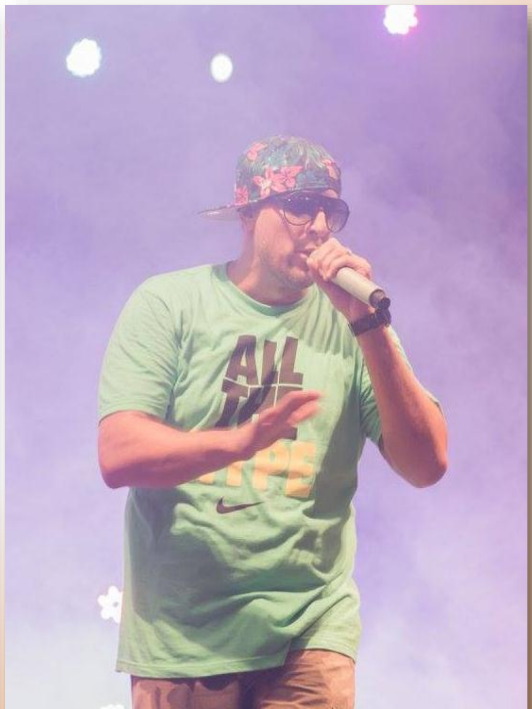
T – Bone