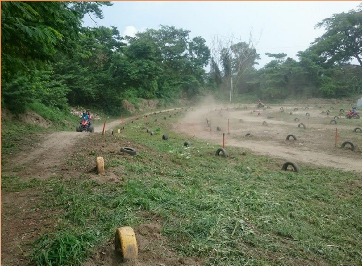
Zona de cuatrimotos