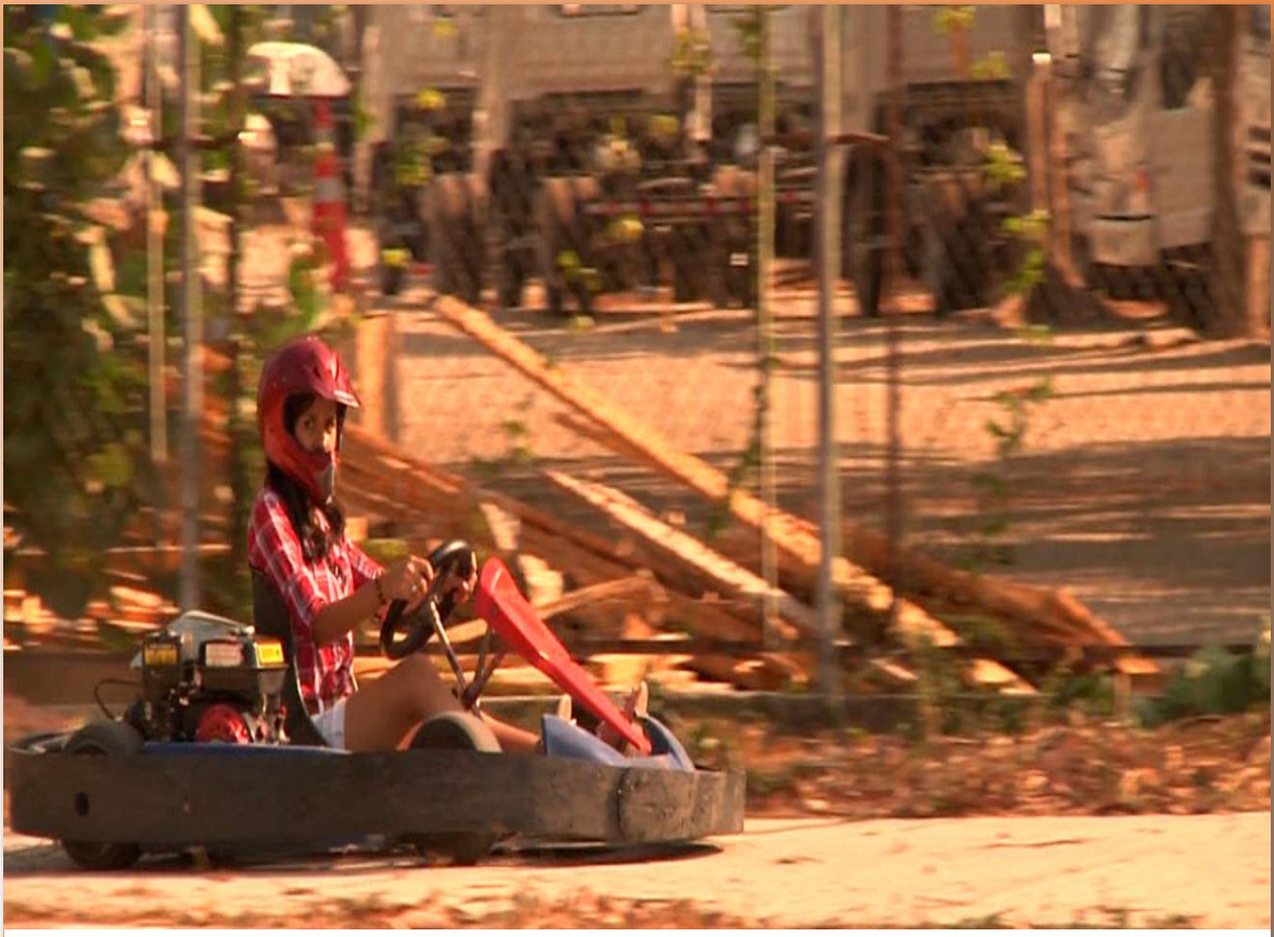
Zona de karting