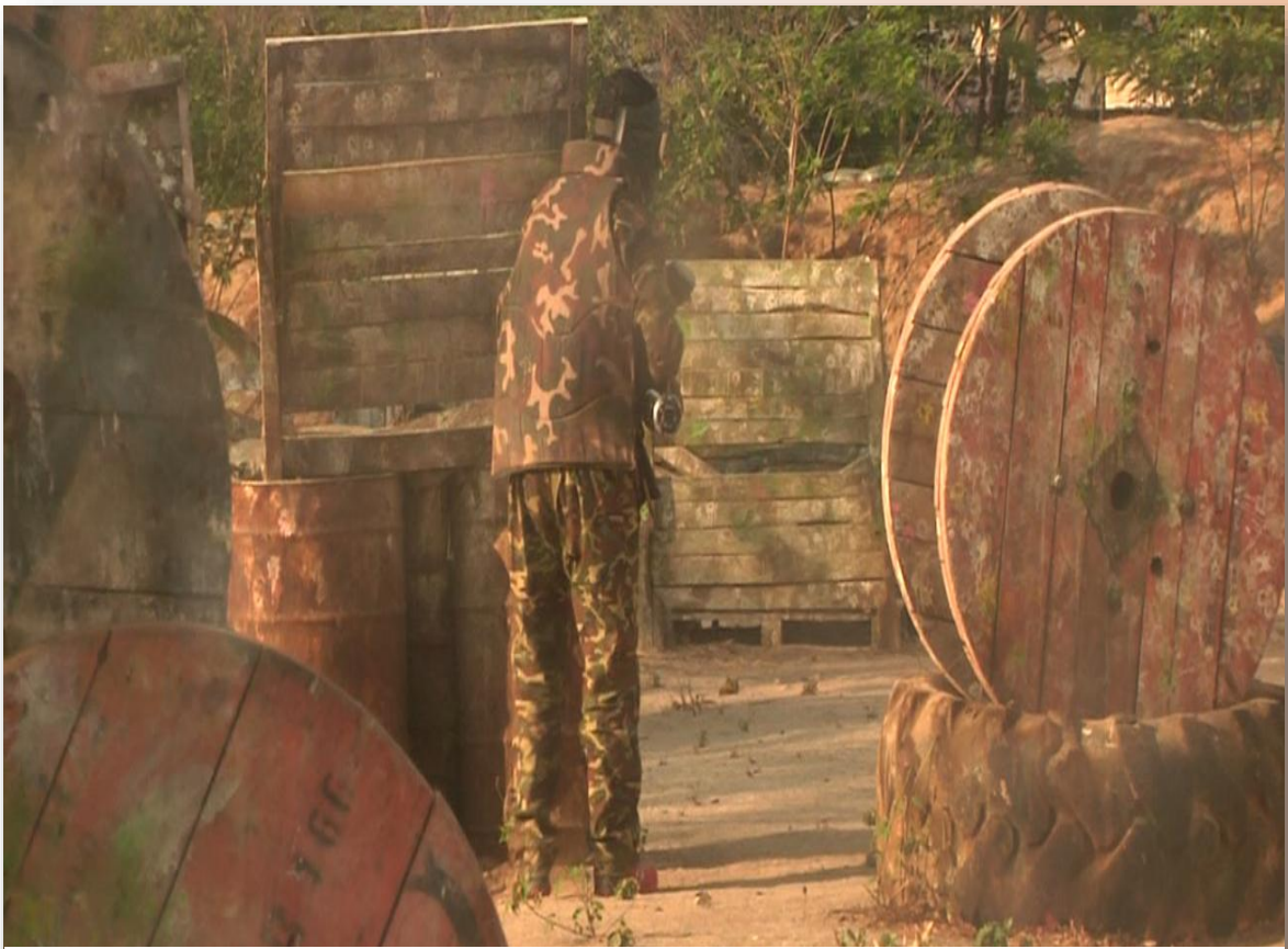
Zona de Paintball