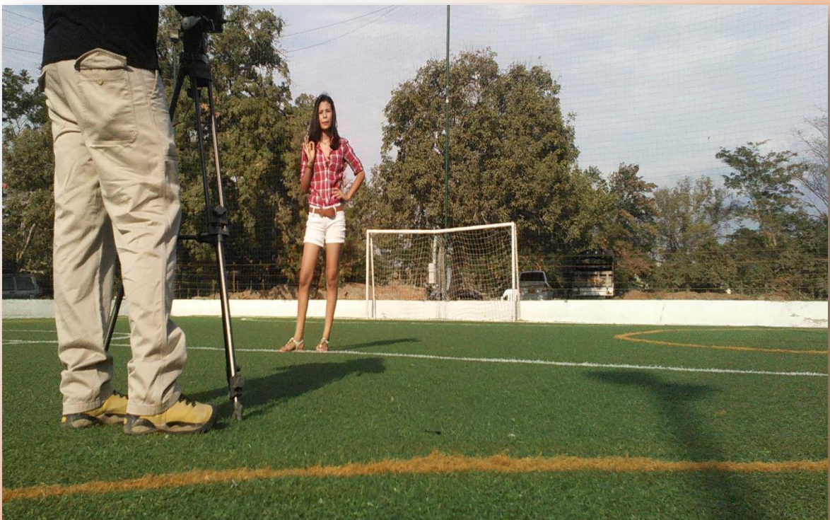
Cancha sintética de fútbol