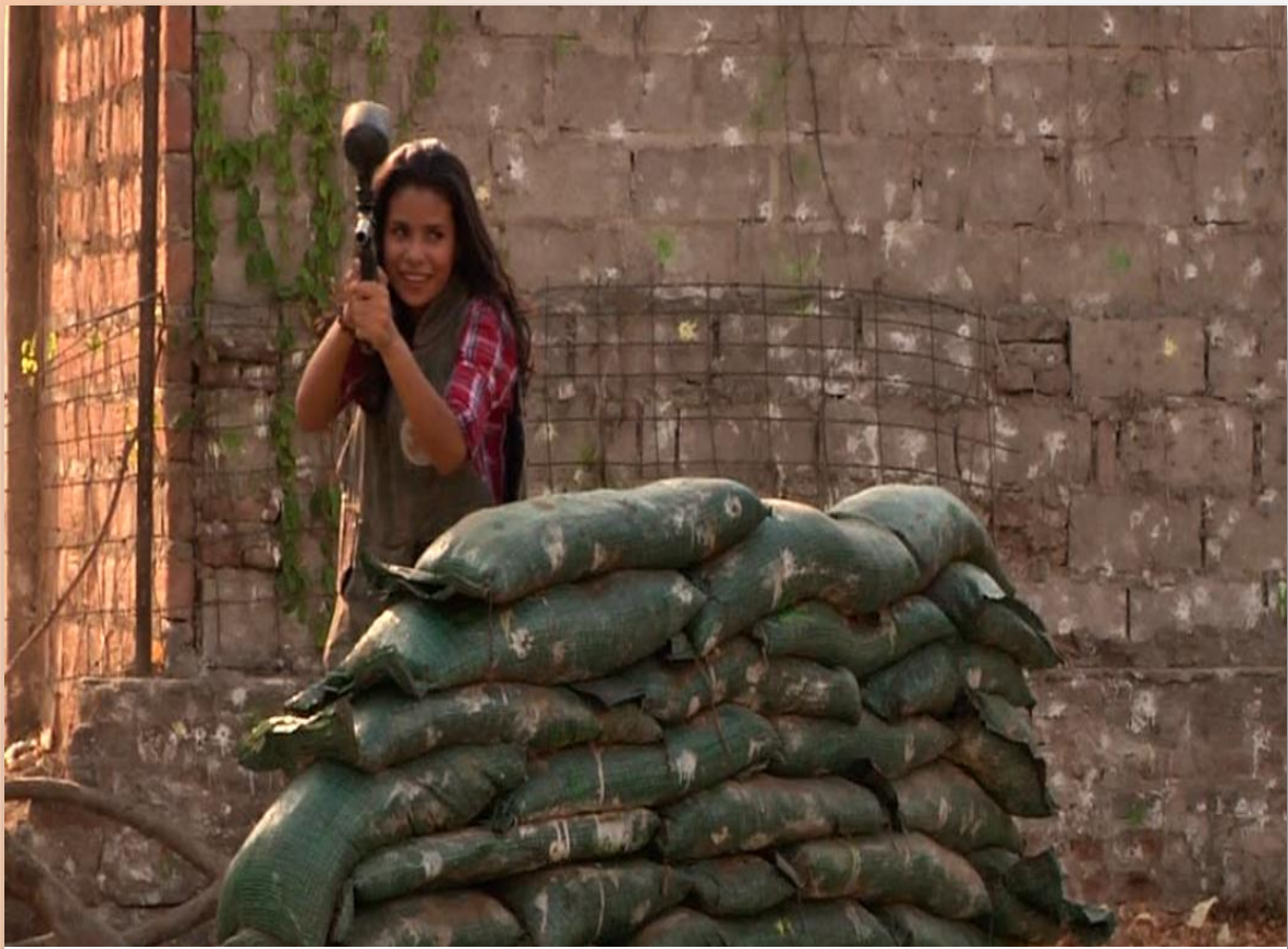
Zona de Paintball